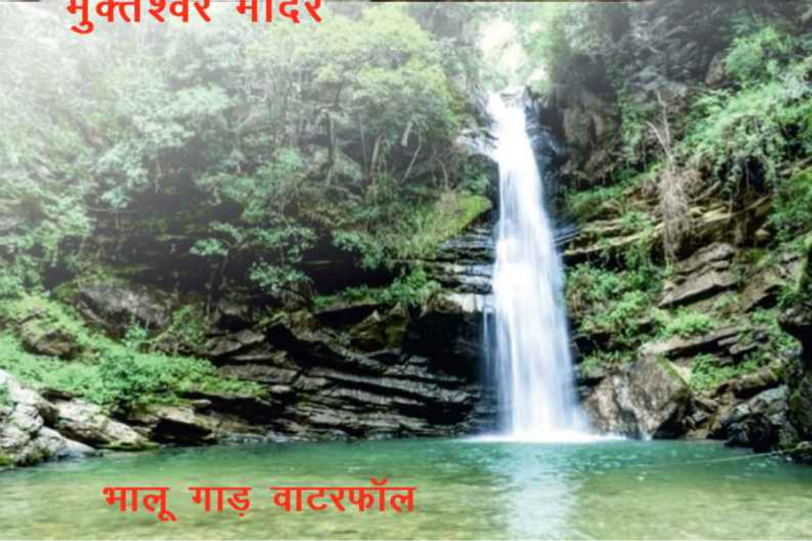
भालू गाड़ वाटरफॉल