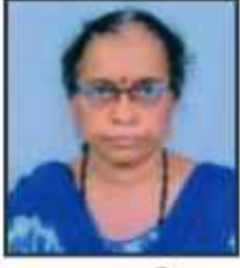
राजश्री क्षे.स.ई. धारवाड़