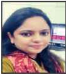
फरहत नाज़ हिंदी समाचार कक्ष